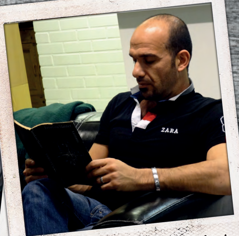
Khatam ja hiljainen hetki