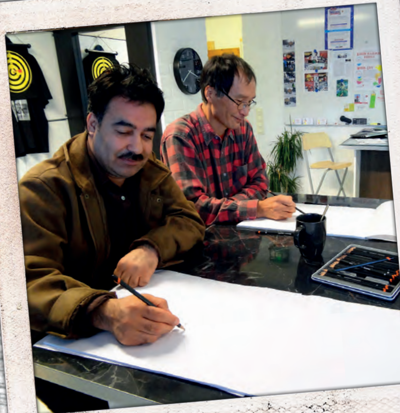
Tatsu opettaa piirtämistä